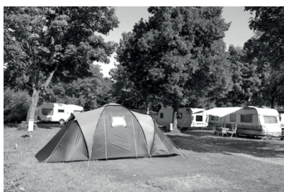
1 C A M P I N G