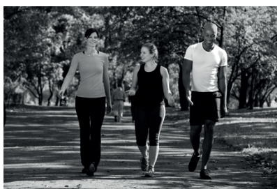
2 P R O M E N A D E