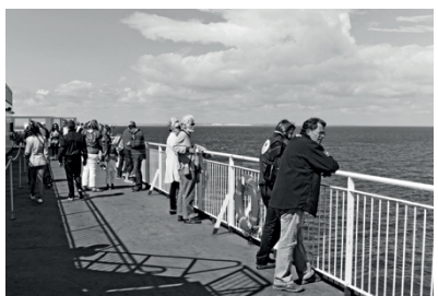
4 C R O I S I È R E