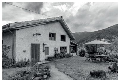
6 G Î T E