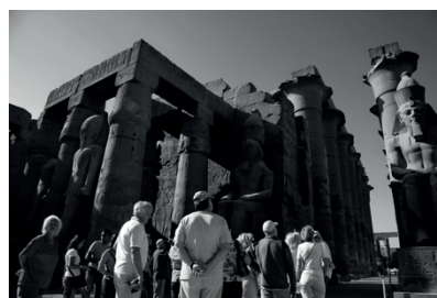
3 T O U R