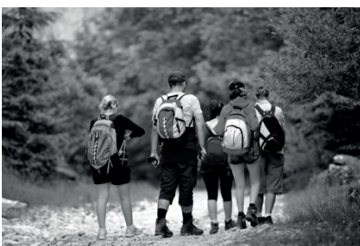
5 E X C U R S I O N